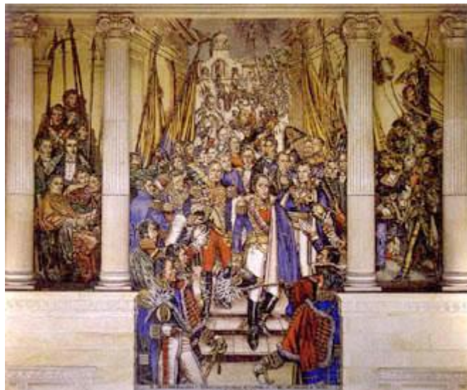
Mural en el Salón Elíptico del Capitolio Nacional