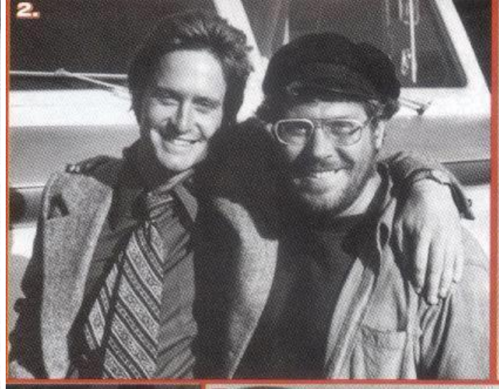
Con Sally Field, en La Monja Voladora, y con Michael Douglas en Las Calles de San Francisco

En 1984 regresa a Colombia a encarnar magníficos papeles protagónicos de famosas telenovelas como: