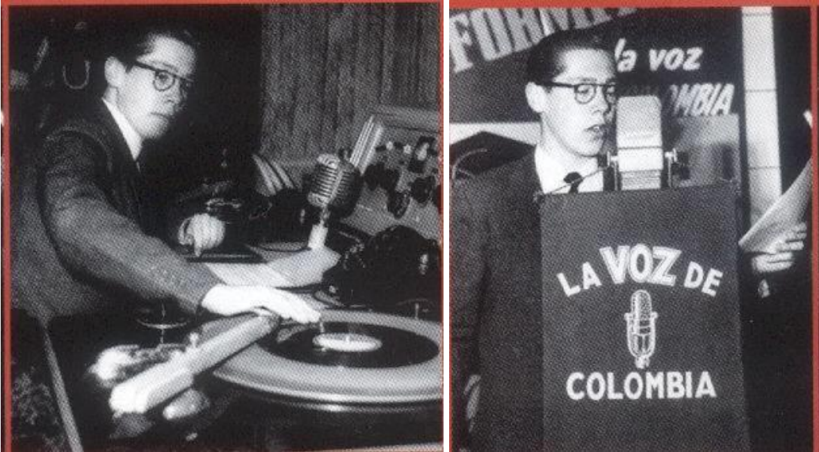
Como programador de Radio Reloj y locutor de La Voz de Colombia

premios Globos de Oro, en Hollywood, lo que también le sirvió para conocer famosas actrices como Grace Kelly y Marilyn Monroe.