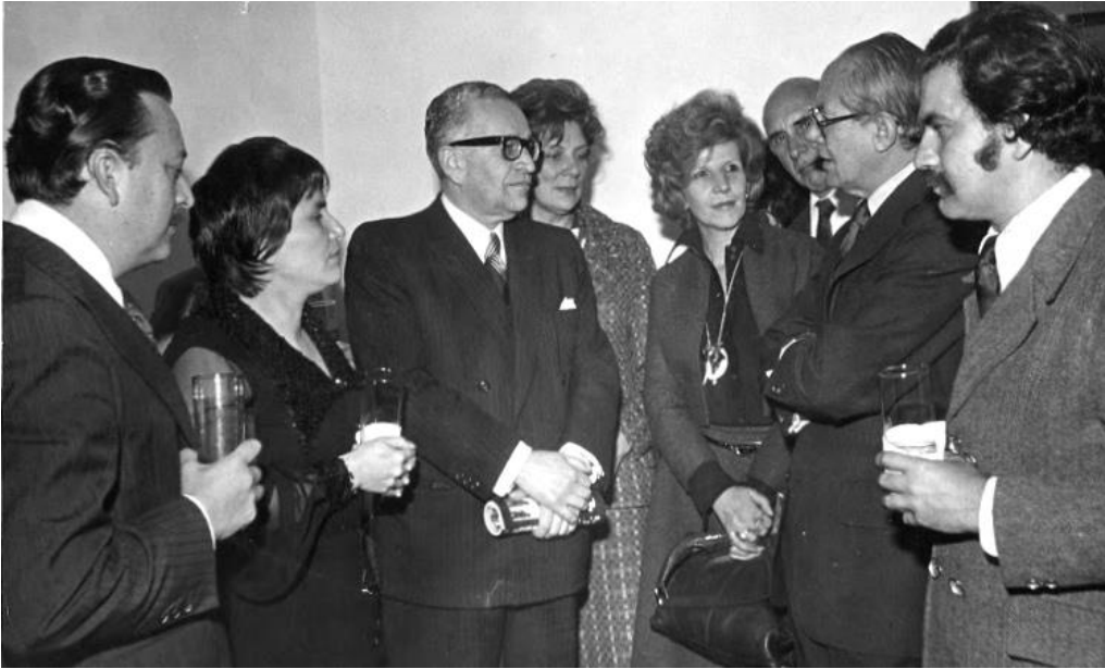
Con el Presidente Alfonso López Michelsen, en el lanzamiento de la revista "Crítica".