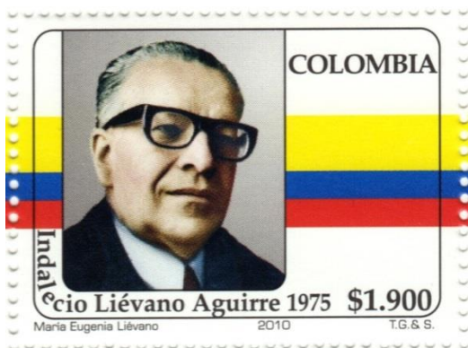
Estampilla del Dr. Liévano Aguirre para los amantes de la Filatelia.

Recibió numerosas condecoraciones, entre ellas; las máximas que confiere España, Venezuela, la Santa Sede, Ecuador, Perú, China, Países Bajos, Argentina y la Gran Cruz de la Orden de Boyacá 1 .